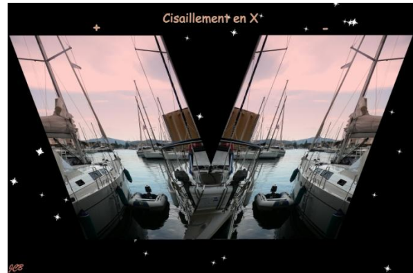
Cisaillement X : + et -