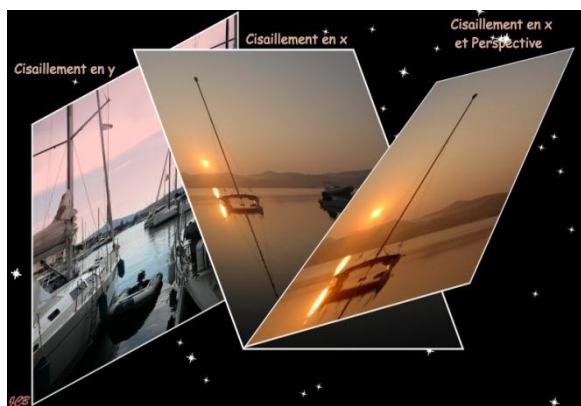
Cisaillement en X et Y plus Outil de perspective