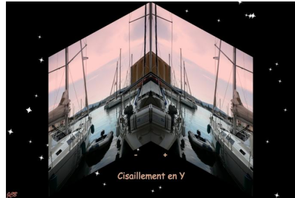
Cisaillement en Y : - et +