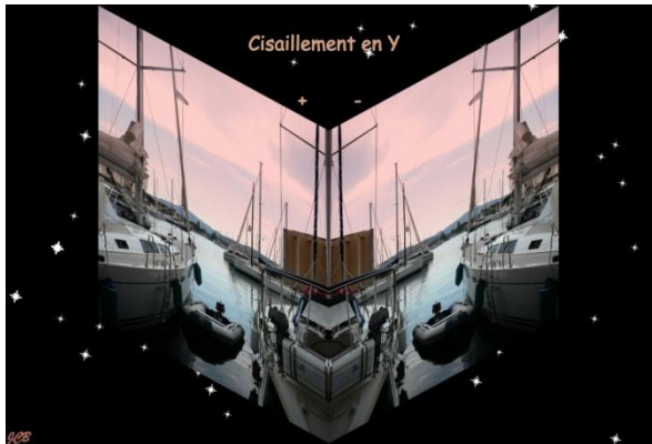
Cisaillement en Y : + et -